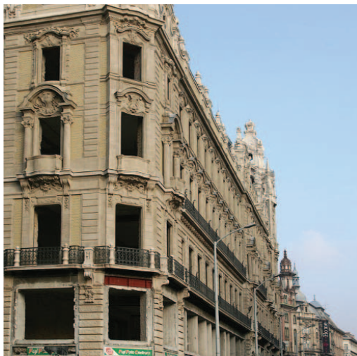
3. ábra: Műemlék jellegű épület felújítása Budapest belvárosában

A korábbi felújítási pályázatok kifutása a támogatásoktól függ, azonban az is lehetséges, hogy azok új formában az Új Széchenyi Terv keretén belül folytatódnak tovább, és fejeződnek be. |